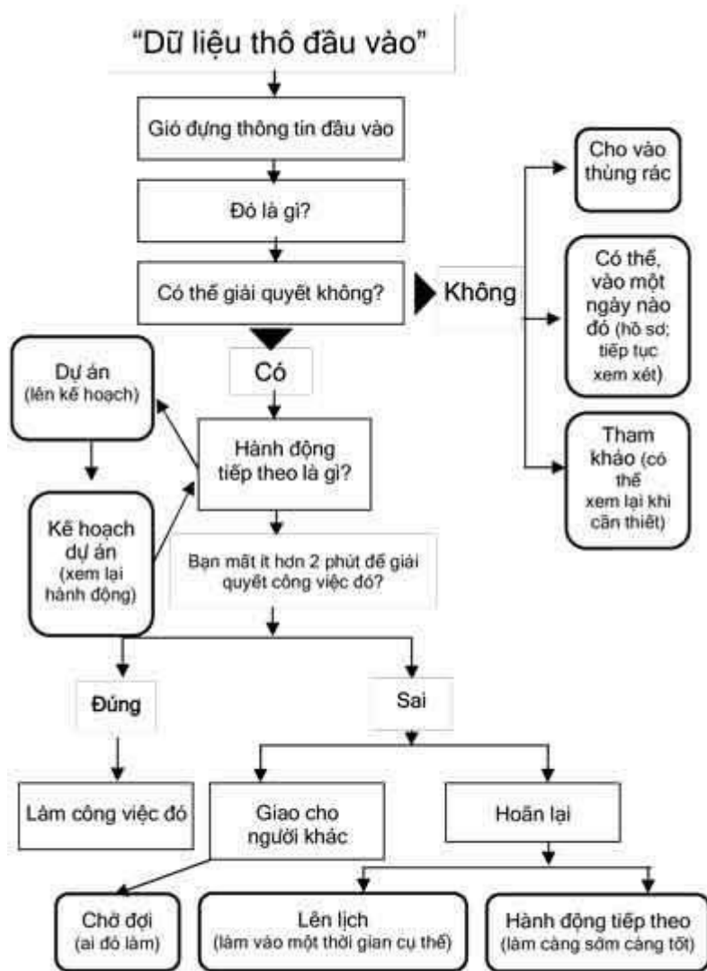
Sơ đồ tổ chức công việc