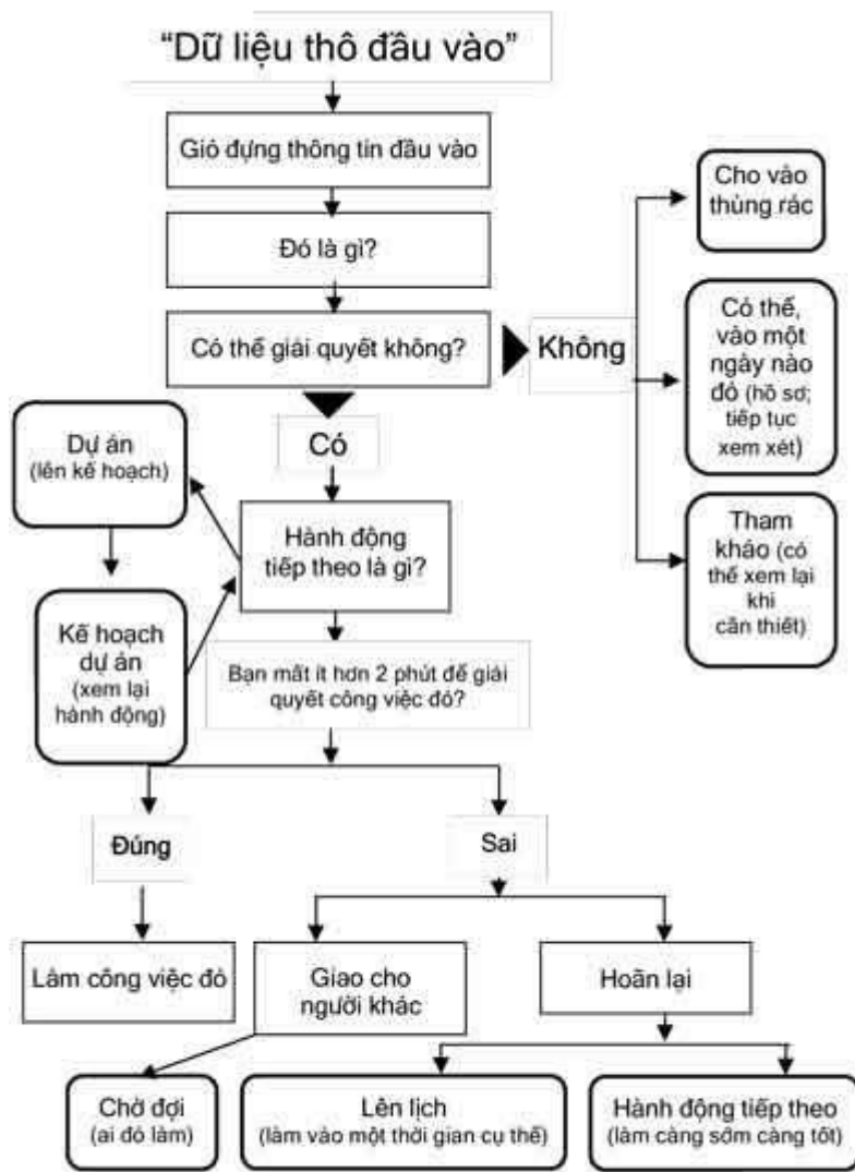
Sơ đồ tổ chức công việc

Danh sách kiểm tra: Các phương tiện nhắc việc sáng tạo