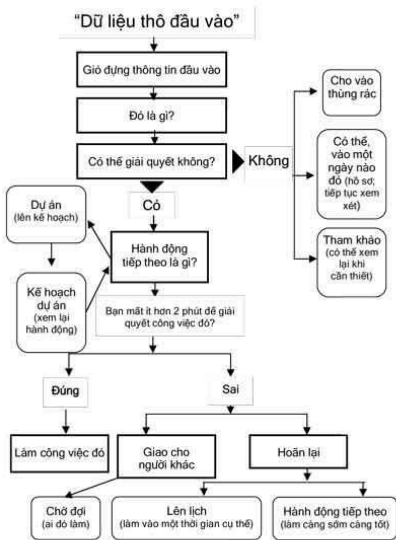
Sơ đồ tổ chức công việc

Tôi khuyên bạn nên đọc toàn bộ chương này và chương sau trước khi bắt đầu xử lý công việc trong hệ thống thông tin. Bạn có thể bỏ qua một vài giai đoạn. Khi tôi tập huấn khách hàng thông qua tiến trình này, công đoạn xử lý công việc trở nên đơn giản hơn.