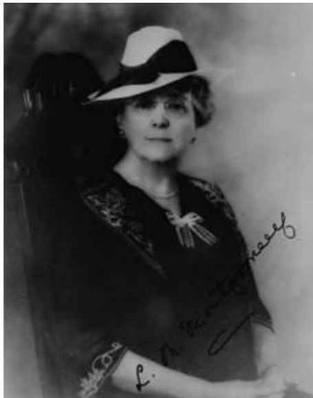
Lucy Maud Montgomery