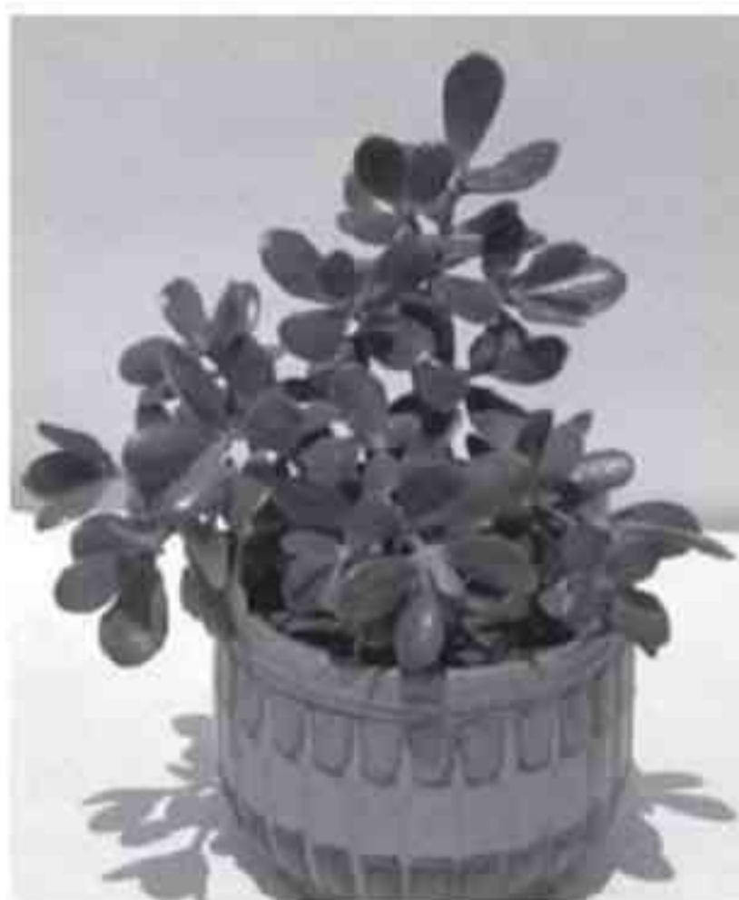
Cây Thạch bích

Hành Thủy thường được sử dụng ở cung Tốn, bởi nước nuôi dưỡng cây, tạo nên sức tăng trưởng ở khu vực này. Các vòi phun nước cũng đặc biệt hữu dụng cho cung này, và tôi thích đặt một vòi nước là một tượng