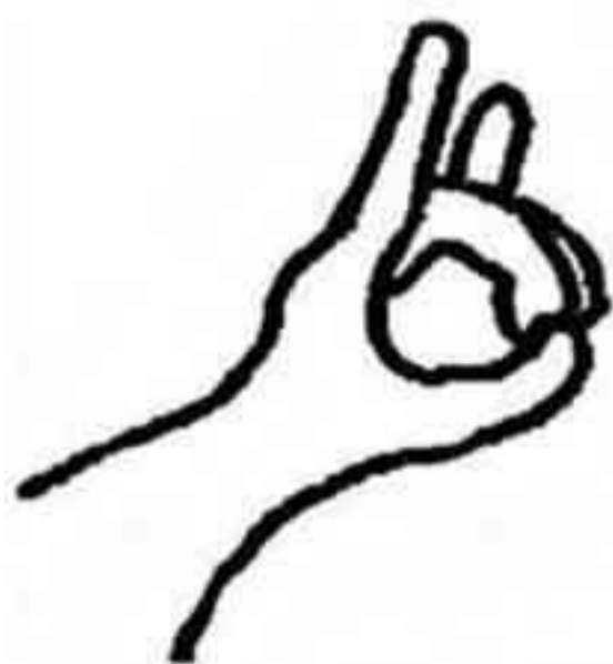
Mudra ban phép, giai đoạn 1.

dùng tay trái, nữ dùng tay phải. Xòe hết năm ngón tay ra, rồi cong ngón giữa và ngón đeo nhẫn lại sao cho chúng chạm vào ngón cái. Khi hai ngón tay đó đã chạm vào ngón cái, mudra này đã trong vị trí sẵn sàng.