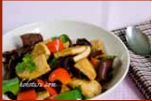
Đậu phụ xào ớt chuông