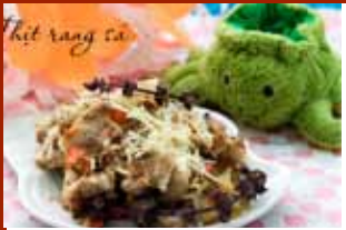
Thịt rang sả