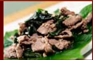
Bò xào lá lốt