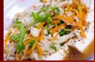
Đậu sốt nấm kim châm