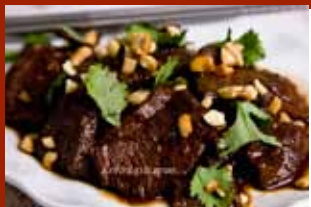
Bò xào cay