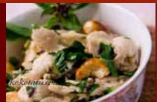
Gà rang hạt điều húng quế