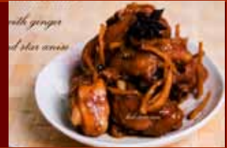
Gà om hoa hồi