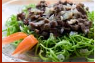
Nộm rau muống thịt bò