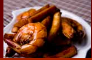
Tôm kho dứa