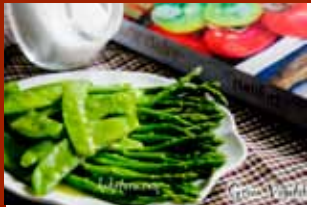
Rau xanh rưới sốt bơ chanh