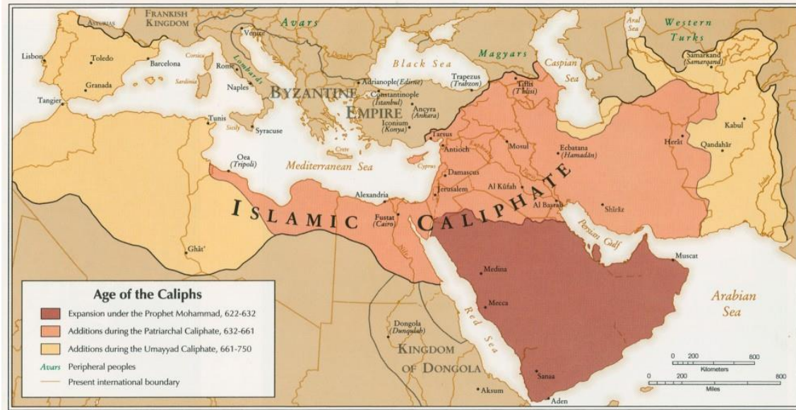
Thời đại các Caliphs